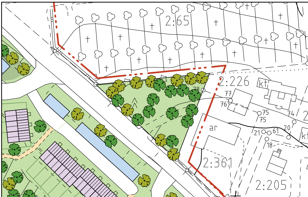
vuonna 2008 Koskenmäki II -asemakaavan muutoksen yhteydessä valittu vaihtoehto