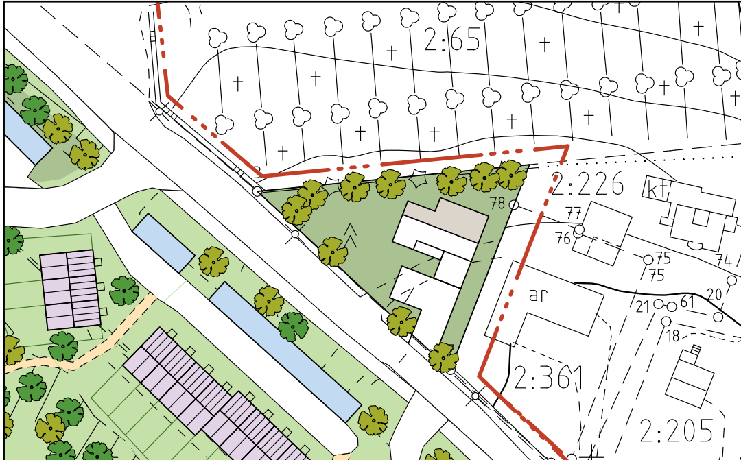
maanomistajan hakemuksen mukainen vaihtoehto maankäytöstä

Tällä sivulla on esitetty vuonna 2008 Koskenmäki II -asemakaavan muutoksen yhteydessä tutkitut maankäyttövaihtoehdot. Tuolloin käytiin samaa keskustelua kiinteistön osan muuttamisesta lähivirkistysalueesta pientalotontiksi. Tuolloin päätettiin säilyttää ko. alue lähivirkistysalueena katukuvallisista syistä johtuen.